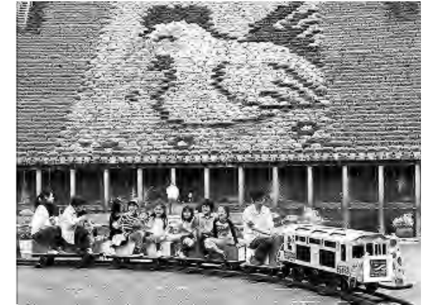
地域イベントにも積極的に参加中! (ミニ鉄道 in 宇治市植物公園)