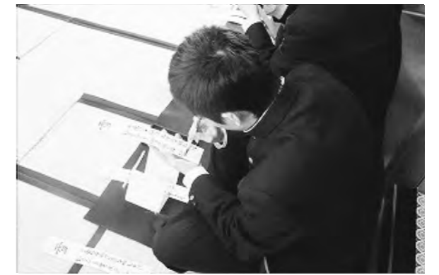
普通科では多くの体験的学習を行っています 「華道体験」・「茶道体験」・「和歌体験」など