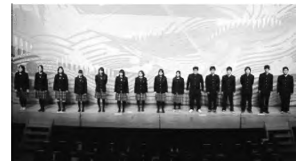
文化系クラブもがんばっています 全国総合文化祭出場・・・「合唱部」「写真部」