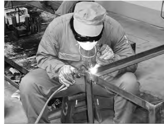
工業技術科・自動車科は「ものづくり」 技能検定で高校生初の資格に挑戦しています