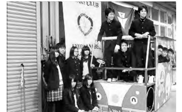
併設校ならではのコラボ。自動車科製作で美術部 ペイントの「ままごとハウス」を福島県に寄贈!