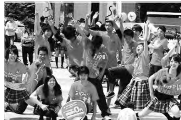
文化祭でもがんばっています! (3年パフォーマンス)