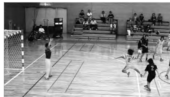
近畿大会出場・・・「女子ハンドボール」 「ウエイトリフティング」「バドミントン」