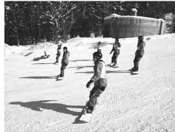
信州方面スキー研修 スノボで颯爽と!