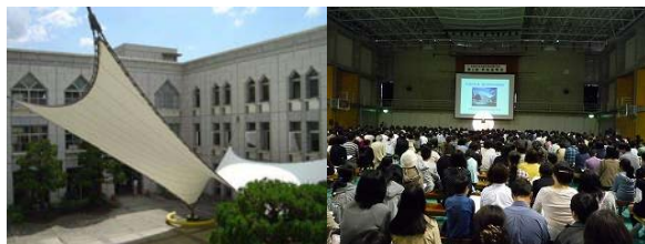
洛北高校附属中学校