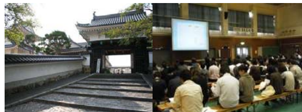
園部高校附属中学校

お問い合わせ先：府教育庁高校教育課 電話 075-414-5853 ◎洛北高校附属中学校 電話 075-781-0020 ◎園部高校附属中学校 電話 0771-62-0051