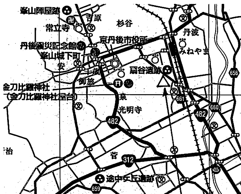
△集合場所 峰山運動公園入口の駐車場