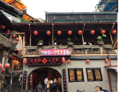
2日目：九份(キュウフン)