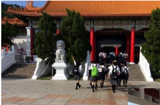
1日目：忠烈祠見学・夜市