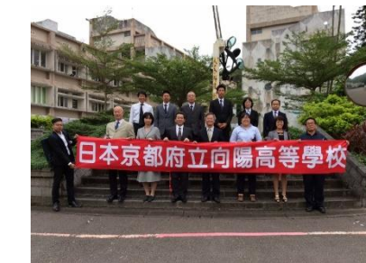
日本京都府立向陽高等学校