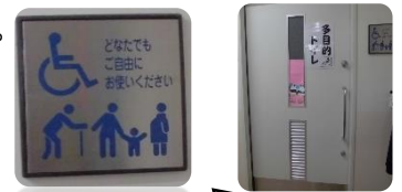
寺田南小の多目的トイレとピクトグラム