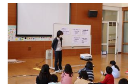
人権アピール集会

また、全校で「みんなのふわふわみつけた」と題して、友達のいいところを見つけ合いカードに書いて教室に掲示しています。和知小学校が笑顔あふれる学校になるように、みんなが頑張っています。