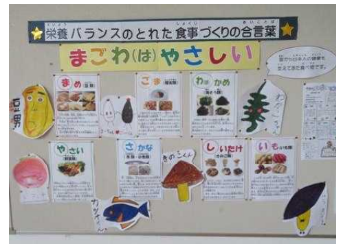
【栄養教諭による授業】