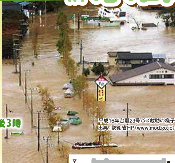
平成16年台風23号バス救助の様子

このキャンプでは、様々な団体のご協力をいただき、地域の避難場所に指定されている公民館での避難所体験や、実際の災害ボランティア活動を学ぶ防災プログラムを取り入れて実施します。