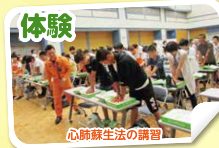
心肺蘇生法の講習