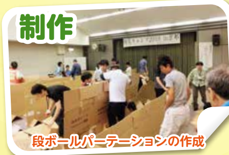
段ボールパーティションの作成