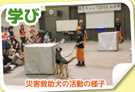
災害救助犬の活動の様子