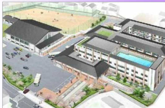
* 上:府立八幡支援学校 下:府立宇治支援学校完成予想図