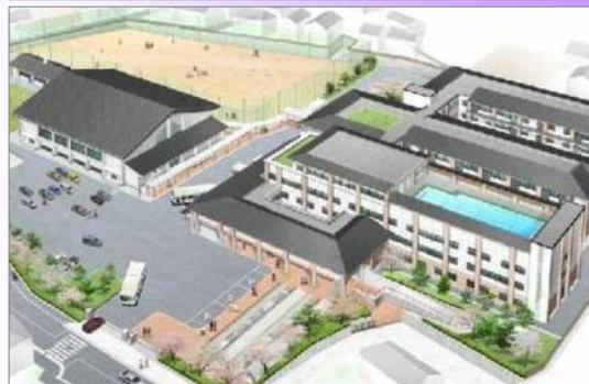
* 上:府立八幡支援学校 下:府立宇治支援学校完成予想図