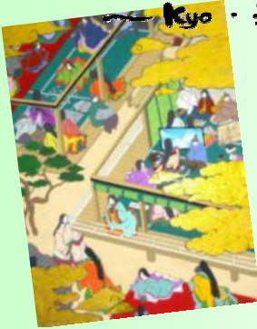
*近畿文大会テーマ・ポスター原画