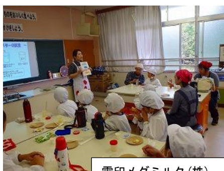
雪印メグミルク (株)