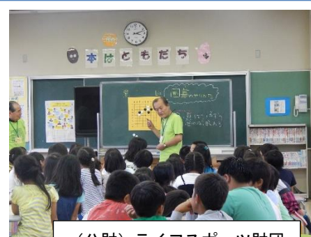
(公財) ライフスポーツ財団