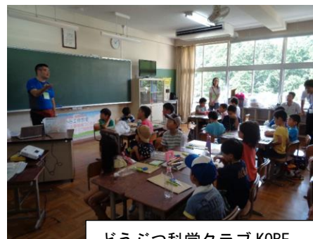
どうぶつ科学クラブ KOBE