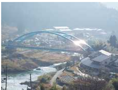
1月2日 穏和な和知の風情