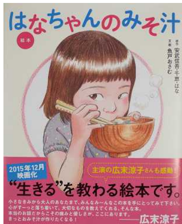
絵本『はなちゃんのみそ汁』