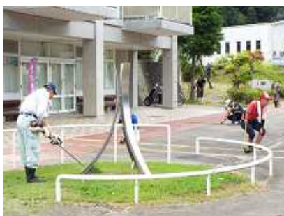
8月21日 PTA環境整備作業 校舎内外が大変綺麗に