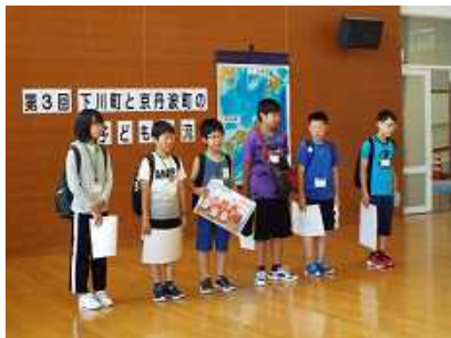
7月29日 第3回子ども交流会 北海道下川小から6名が来校

8月29日から2学期が始まりました。夏休み中ひっそりしていた学校も、子ども達の元気な声が響き、活気が戻ってきました。