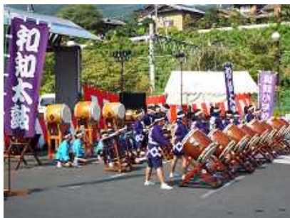
8月20日 和知ふるさとまつり 太鼓クラブ4・5・6年が出演

さて、この夏休みに開催しました個別懇談・学力アップ教室・わち子どもの集い・北海道下川小児童との交流会・クラブ活動・ふるさとまつりへの太鼓クラブ出演等、保護者の皆様によるプール監視・環境整備作業など、たくさんの行事や取組が着実に実施できました。これもPTAをはじめとする各種団体・ご家庭の皆様方のご協力によるものと感謝申し上げます。一人一人の児童が、これらの行事や取組で得た学びを、2学期の学校生活に活かしてくれています。