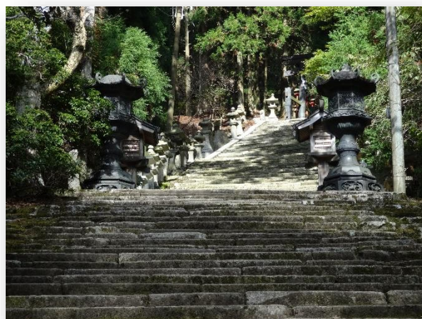
例年ここで集合写真を撮ります。