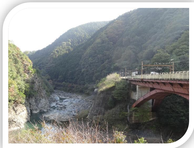
JR 保津峡駅付近の様子です。