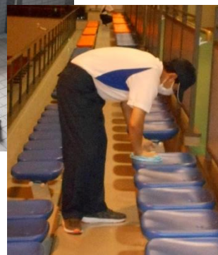
(地域の方の声) 綺麗に清掃してくれてありがとう!! 助かります。