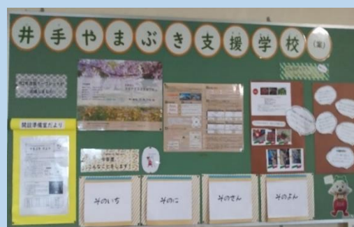
<玄関横掲示板をリニューアルしました>

新設校開設に向けての準備の内容については、学校掲示板やホームページ、学校だより、準備室だより等をとおして、随時情報発信をしていきます。6月には新設校PTA準備委員会も発足しました。学校づくりに向けて、ぜひ保護者の方々の御意見も聞かせてください。