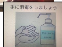
生徒が作成したパワーポイントと手洗い動画です