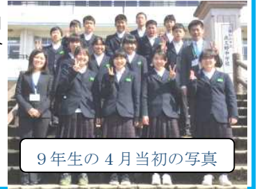
9年生の4月当初の写真

最後に「誇り」を掲げました。9年間、夜久野学園で学んだことが誇りと感じられるよう一日を大切に過ごすことを期待しています。9年生にとって、3学期の登校日は卒業式を入れて45日しかないのです。