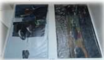
体育館の入口に展示してある絵画も保ヶ淵さんの作品です。

かて動だ れて活や いま躍独 すし立 いたし ます。た 人動 物に が平 お和 描い 運 た