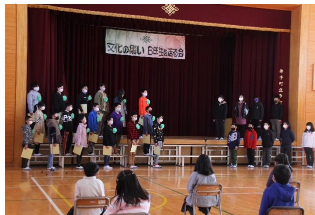
リーダー引き継ぎ式

保護者の皆様にご覧いただくことはできませんでしたが、 3月5日(金)17時まで 期間限定で動画配信しております。