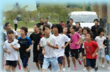
最後はみんなで記念写真