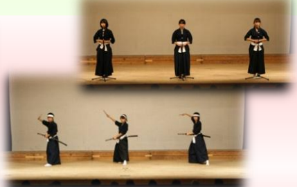
京都府立園部高等学校・園部高等学校附属中学校 吟詠剣詩舞部 「勧学」「楠公子に訣るの図に題す」「川中島」