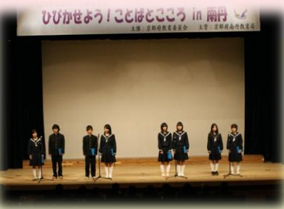
南丹市立美山中学校 朗読 演劇の世界「青空へつづる手紙」