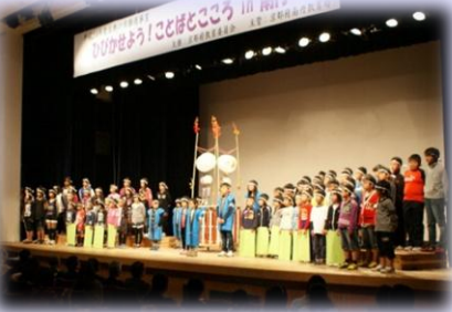
京丹波町立下山小学校 「誕生！下山小音頭」