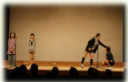
亀岡市立詳徳小学校 「しちどぎつね」