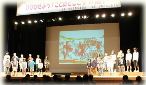
南丹市立鶴ヶ岡小学校 鶴ヶ岡の昔話 「狸と上げ松～狸のあたごさん参り～」