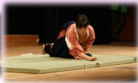
「小倉百人一首 競技かるた」の実演も。

南丹市立鶴ヶ岡小学校の発表をスタートに、朗読や踊り、地域に伝わる昔話、伝統芸能、生徒会の取組、中には学校で勉強した外国語についてなど、様々な内容の発表が行われ、大いに盛り上がりました。