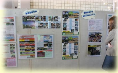
管内府立学校のパネル展示