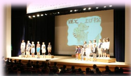
大舞台での発表、 見事でした!