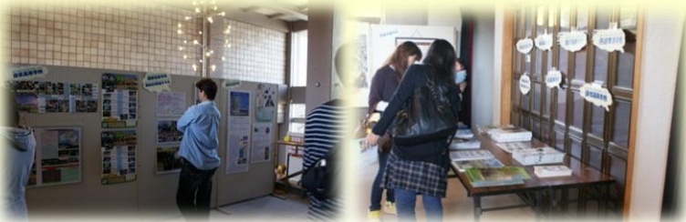
管内の府立学校パネル展示には、多くの人々が見学に。

会場入り口には、管内の府立学校を紹介するパネル展示や学校案内パンフレットなどを設置し、各校の活動や取組の様子を伝えました。