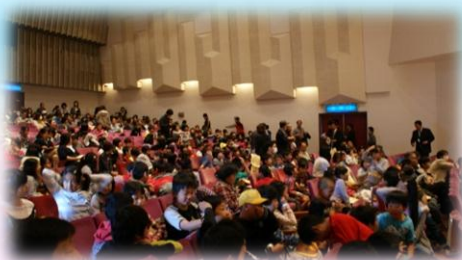
会場は観客でいっぱいでした。

当日は、気持ちのよい秋晴れにも恵まれ、各校の先生方や学校関係者だけでなく、たくさんの保護者や地域の方々にも御参観いただき、総勢600名を超える大変大きな発表会となりました。