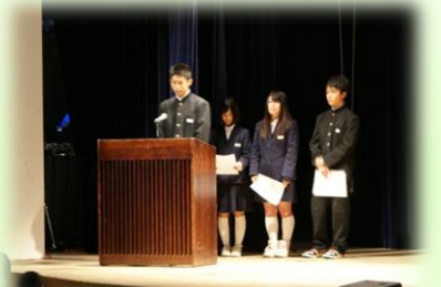
京丹波町立蒲生野中学校 「ふくしまっ子応援・京・体験プロジェクト 2012」 に取り組んで（拡げよう支援と交流の輪）