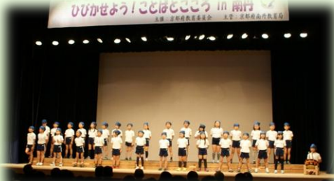
亀岡市立千代川小学校 「おまつり」