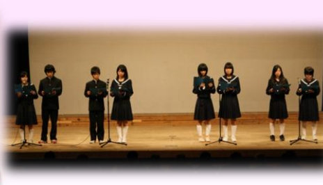
さすが中学生。 堂々とした発表でした!