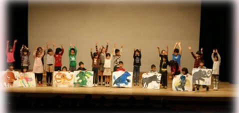
亀岡市立南つつじヶ丘小学校 英語のチャンツ「From head to toe」