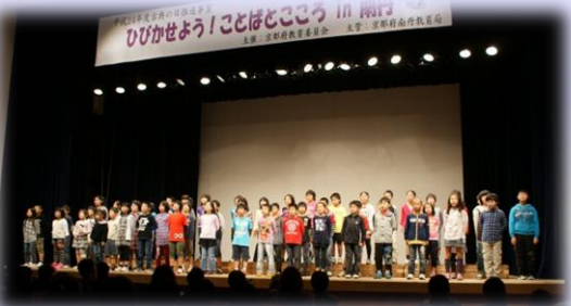
南丹市立園部第二小学校 未来へ向かって ～「あるけ あるけ」「雨ニモマケズ」～