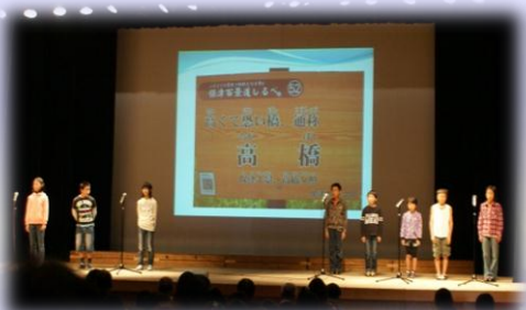
亀岡市立保津小学校 「下みるな、前みて渡れ、 保津の高橋（たかばし）」