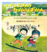
わたしたちのカメムシずかん