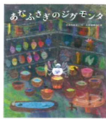
あなふさぎのジグモンタ