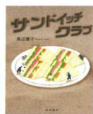
サンドイッチクラブ