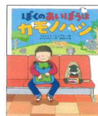
ぼくのあいぼうはカモノハシ