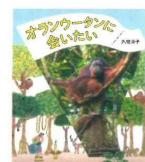
オランウータンに会いたい