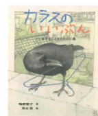
カラスのいいぶん