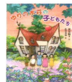
ゆりの木荘の子どもたち