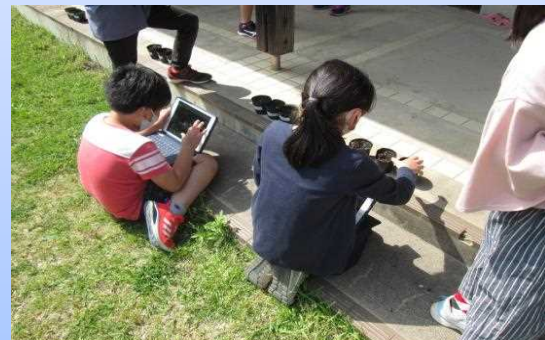
3年生理科 植物の観察記録をつけています。