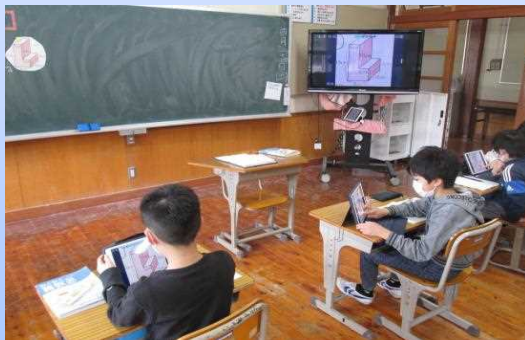
5年生算数 体積の学習をしています。

京丹波町ではICT環境の整備が進められ、昨年度の3月から学習系タブレット端末が、児童1人に1台配備されています。本校でも授業の中でタブレットを活用し、子どもたちも少しずつ操作に慣れてきました。その様子を少しご紹介します。