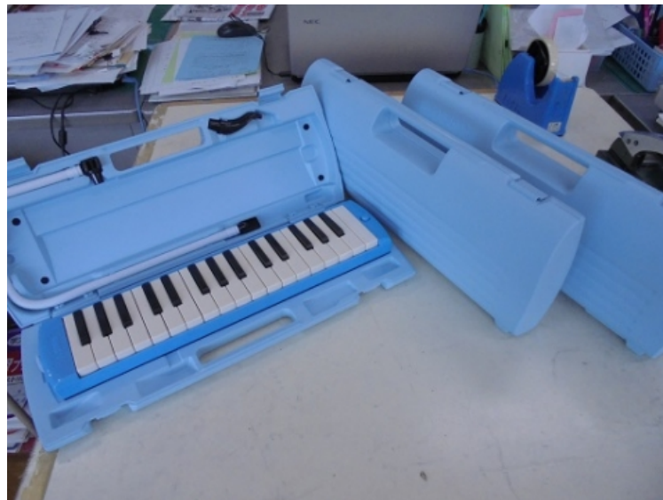
液晶テレビ・ディスプレイスタンド 各2台

学校で整備しているものがかなり古くなっているため、年次計画で少しずつ買い替えを行っています。