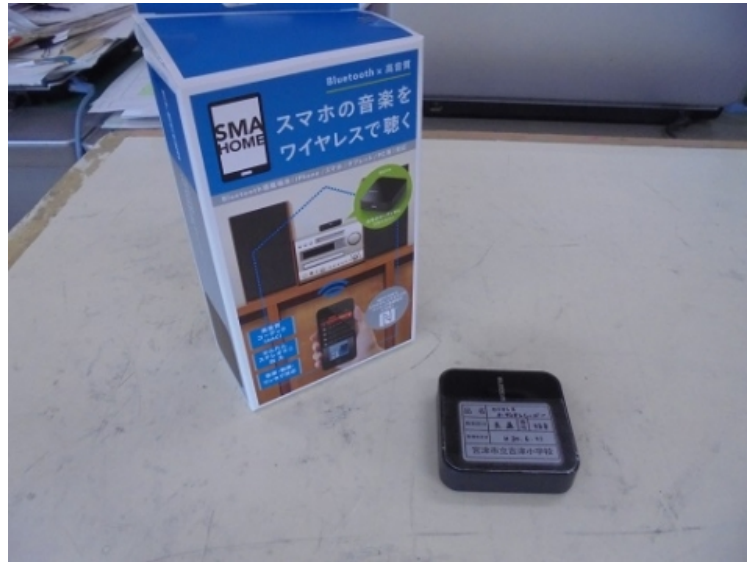
タイムタイマー 特別支援教材