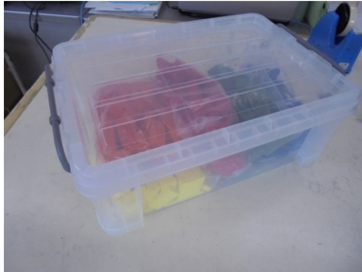
鍵盤ハーモニカ × 4台

学校で整備しているものがかなり古くなっているため、年次計画で少しずつ買い替えを行っています。