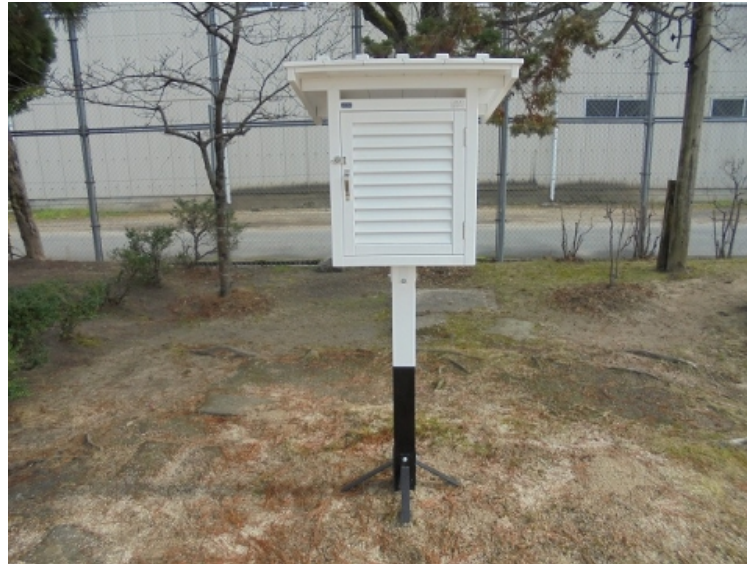
担架及び担架収納ボックス

もともとあった物はかなり古く、スチール製でとても重たいものでした。アルミ製の物を購入し、児童の怪我等に迅速に対応できるよう、収納ボックスも購入し、児童玄関に設置しました。