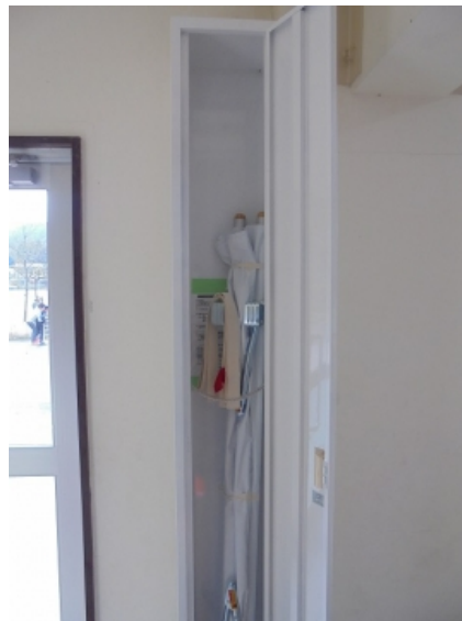
体育館玄関ガラス戸 ガラス交換

もともとあった物はかなり古く、スチール製でとても重たいものでした。アルミ製の物を購入し、児童の怪我等に迅速に対応できるよう、収納ボックスも購入し、児童玄関に設置しました。