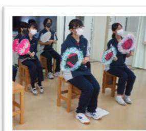
八寿園デイサービス