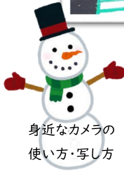
身近なカメラの 使い方・写し方