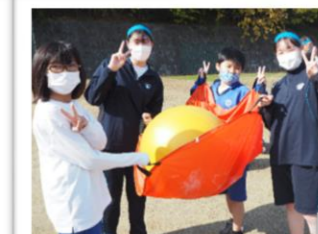
南キャンパス体育祭