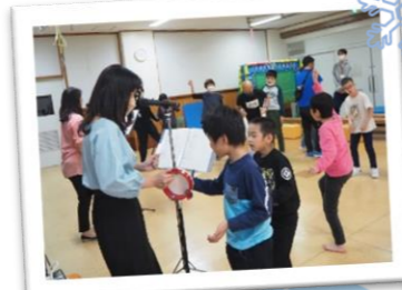
PolePoleさんの会 ボランティア団体