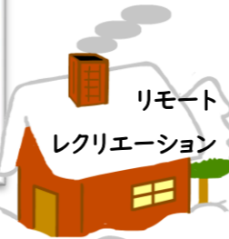
リモート レクリエーション

地域の方に来校いただいたり、リモートを活用したりして、たくさんの交流をお世話になりました。