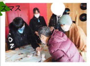
だんだん はっぴークリスマス