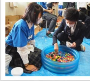
南キャンパス文化祭