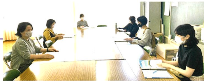
第一回親心サークルの様子。かなり話に花が咲きました…。

八幡支援学校PTAに、「フラダンスサークル」・「茶道サークル」に加えて、今年度より新たに「親心サークル」が発足しました！