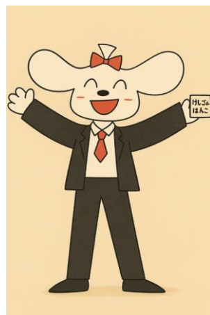
ひらばやしーずー