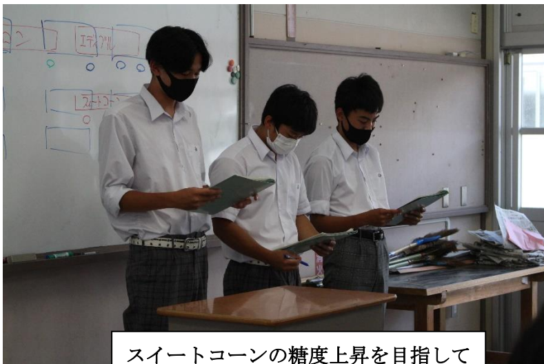
スイートコーンの糖度上昇を目指して

6月9日(水)5限目に課題研究計画発表会を実施しました。多くの先生方にご参加いただき、生徒達は緊張しながらの発表となり思うように説明できない場面がありました。発表後は反省と同時に実績発表では挽回をしたいと決意を新たにしていました。