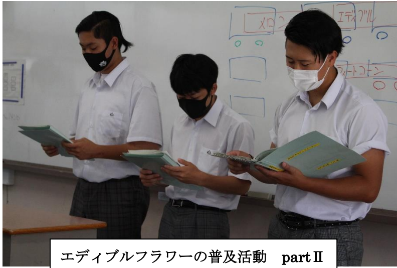
エディブルフラワーの普及活動 part II