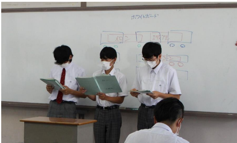
規格外野菜の有効利用と奈具丘メロンの品質向上を目指して