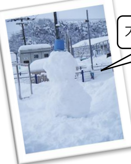
大きな雪だるま完成！