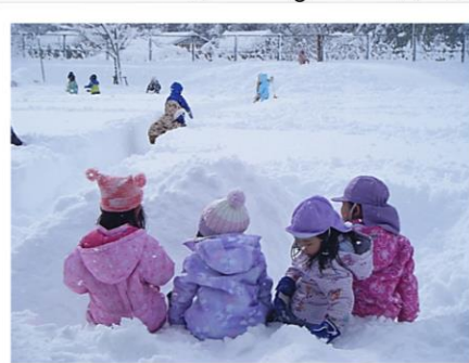
何を話しているのかな？