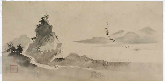
狩野興也筆 「瀟湘八景図巻」(部分) 個人蔵