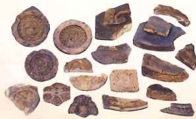
金箔瓦(聚楽第跡出土)

応仁・文明の乱を端緒として幕を開けた戦国時代。南山城も、その争乱の大きな渦に飲み込まれていきます。南山城の状況について、中世城館跡の発掘調査成果等を中心に紹介します。