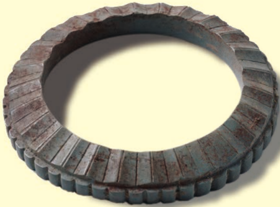
石剣（城陽市西山2号墳：同志社大学歴史資料館所蔵）