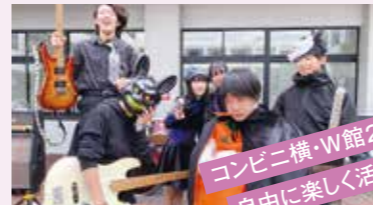
コンビニ横・W館2階で 自由に楽しく活動中!!