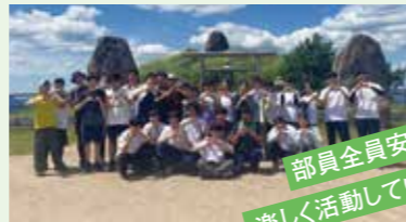
部員全員安全に 楽しく活動しています