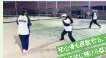
初心者も経験者も、一緒に 練習して共に輝ける部活です。