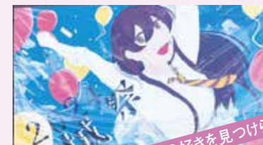
自分の好きを見つけられます!