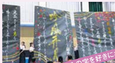
自分の字を好きになろう!