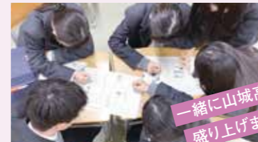
一緒に山城高校を 盛り上げましょう!!