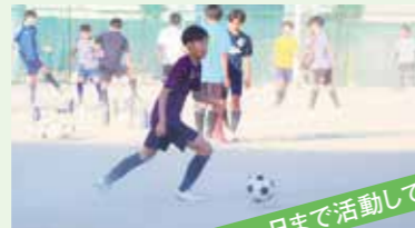
火～日まで活動しています。