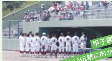
甲子園出場 新しい伝統に向かって