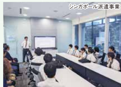
シンガポール派遣事業

ドイツやオーストラリア、シンガポールへの派遣事業を行っています。現地の国の学校の生徒と交流したり、その国の文化を学んだりします。英語を上達させるだけでなく、さまざまな文化が存在する国に滞在することで、異なる文化を受け入れ共生していく態度を養います。