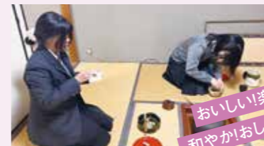
おいしい!楽しい! 和やか!おしとやか!