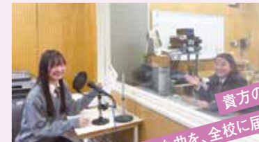
貴方の声を、 好きな曲を、全校に届けよう。