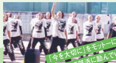
「今を大切に」をモットーに日々、 全力で部活に励んでいます!!