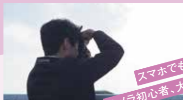
スマホでもOK! カメラ初心者、大歓迎!