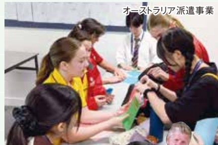
オーストラリア派遣事業