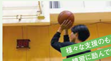
様々な支援のもとで、 練習に励んでいます