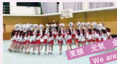
笑顔 元気 全力で We are BTC!