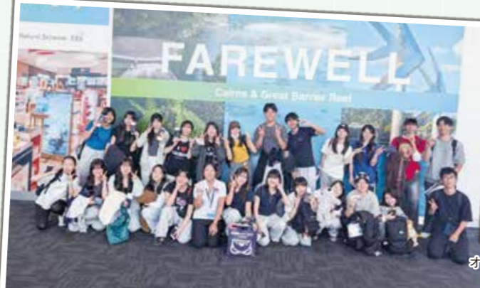
オーストラリア派遣事業