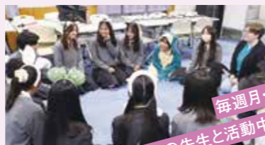
毎週月・水に ALTの先生と活動中です!