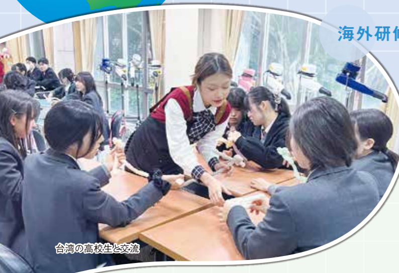
台湾の高校生と交流

ワールドワイドパイオニア育成プロジェクトでは、国内外での国際交流を通じて本校の教育目標の1つである「グローバルリーダーの育成」を目指します。