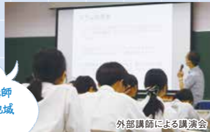
外部講師による講演会