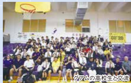
グアムの高校生と交流