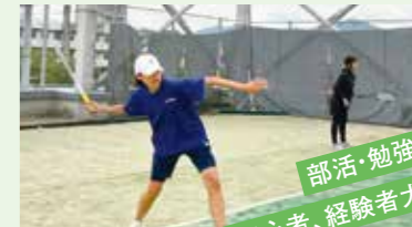
部活・勉強・青春 初心者、経験者大歓迎!!