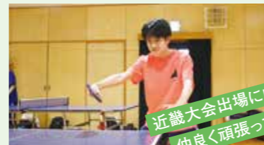
近畿大会出場に向け、 仲良く頑張っています!