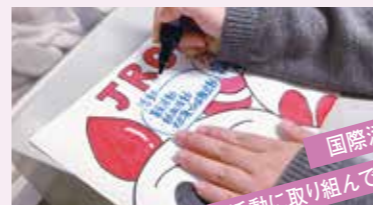
国際活動や 支援活動に取り組んでいます!