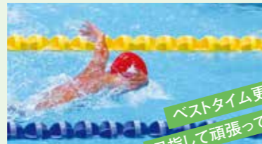
ベストタイム更新を 目指して頑張っています。