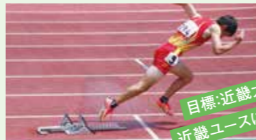
目標:近畿大会・ 近畿ユースに出場