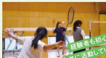
経験者も初心者も 共に活動しています!