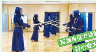
百錬自得で活動中。 初心者大歓迎!