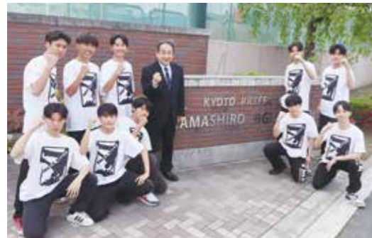
ダンス部男子メンバーとともに (令和7年度 全日本高校ストリートダンスクライマックス ファイナル特別賞受賞)

確かな力を身につけたい! 「学力向上・探究活動・進路実現」 世界へ飛び出したい! 「未来を切り拓くワールドワイドパイオニアへの挑戦」 新しい自分に出会いたい! 「部活動も行事も、仲間とともに全力投球」