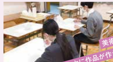
美術室で 自由に作品が作れます!