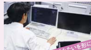
やってみたいを形にしよう!!