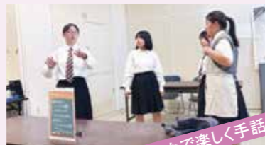
みんなで楽しく手話しよう!