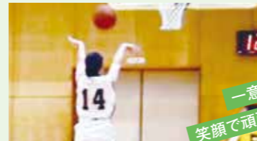
一意専心 笑顔で頑張ろう!