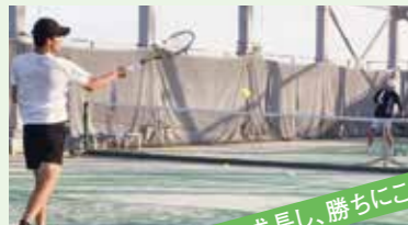
毎日成長し、勝ちにこだわる