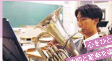
心をひとつに! 仲間と音楽を楽しもう