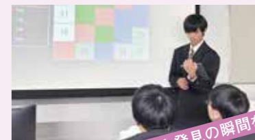
学びと発見の瞬間を共に!!