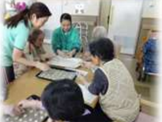
グリーンビラ夜久野