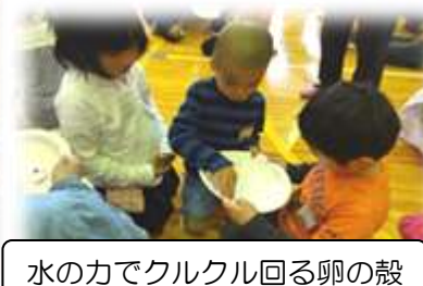
水の水の力でクルクル回る卵の殻