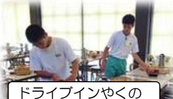
ドライブインやくの