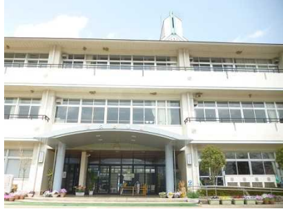
夜久野学園 教職員一同

開校8年目を迎えた夜久野学園は、毎年、地域の皆さんの支えによって学校教育が推進されています。しかし、今年度は新型コロナウイルス感染症拡大防止対策で、休業措置や行事の中止や延期、日々の感染防止の取組の実施など例年にならぬ状況の中で一学期が終了しました。予定していた地域連携の取組もほとんど実施することができない状況です。二学期以降については可能な範囲で進めていきたいと思っております。 夏季休業も短縮され、すでに八月二十四日から二学期が始まりました。この夏は、全国的に猛暑になっていきます。二学期が始まる前から福知山でも連日猛暑日が続く、熱中症の予防措置も取りながらの活動になっていきます。 二学期の行事については、体育祭を九月二十一日の実施予定です。感染防止対策として参観については、保護者(家族)のみとします。ご理解をお願いいたします。また、文化祭についても十月三十一日(土)に実施を予定していますが、詳細については現在協議をしています。 修学旅行(宿泊を伴う行事)については、本当に残念ではありますが、市教委からの発表のとおり中止が決定されました。ただ、9年生と6年生については、日帰りの校外学習の実施を検討しています。九月二日の説明会で現時点の学園の考えをお話しさせていただきます。 一刻も早い新型コロナウイルス(終息)を願いつつ、今後の教育活動を進めていきます。今後ともご理解とご協力よろしくお願いたします。