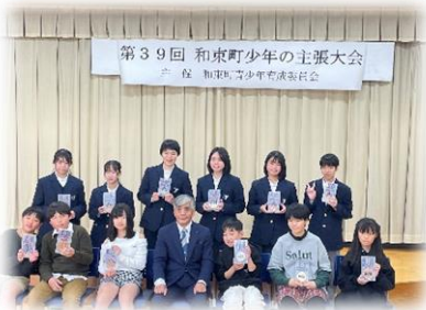
第39回 和東町少年の主張大会 主催 和東町青少年育成委員会

そんな今年の締めくくりの一つとして、和東中学校では「和東中作品展」を開催します。12月14日（木）～20日（水）まで（土日を除く）、子どもたちの今年度の学習の成果を多くの方々に知っていただく機会として、開催するものです。三者面談期間の開催としておりますので、保護者の皆様には三者面談でお越しの際に作品をゆっくりご覧ください。また、地域の皆様にも日頃の子どもたちの頑張りをご覧ください。大変嬉しく思います。保護者の皆様には三者面談に合わせ、時間を14:15～16:30とした案内を配付させていただきますが、作品は常設しておりますので、地域の皆様におかれましては、ご都合のいい時間にお越しいただければ、と思います。作品を通して、子どもたちが積み重ねた学びをご覧ください。子どもたちに励ましの声をかけていただきたく、ご案内申し上げます。どうぞ、よろしくお願いいたします。