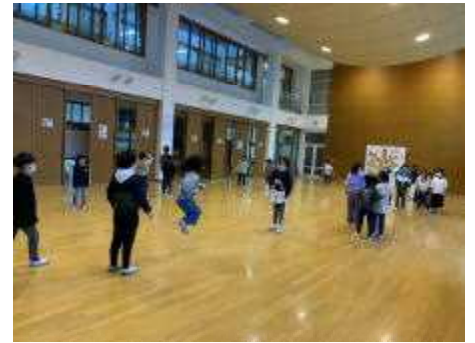
【フレンズ班で大なわとびに挑戦!】

12月より朝のチャレンジタイムでは、月・水・木曜日は短なわとび、金曜日はフレンズ班ごとに大なわとびに取り組んでいます。短なわとびについては体育でも行っています。2月には、なわとび大会を行う予定です。寒さに負けずにがんばる「元気が一番」の和知の子です。