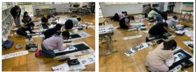
【↑3年生・4年生↑の書き初め練習の様子】

今年度は、各教室前に冬休みの課題としていた書き初めを展示いたします。児童の安全面も考慮し、時間を決めての開催としています。ご了承ください。