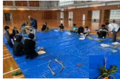
【↑しめ縄作りの様子と5年生の作ったしめ縄→】

12月13日(水)には、5年生が稲わらを使って体育館にて「しめ縄」作りに取り組みました。京丹波町ふるさと資料館の皆様に来ていただき、しめ縄の材料や作り方を教えてもらいながら挑戦しました。ありがとうございました。