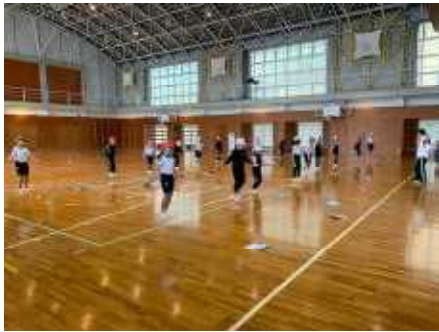
【体育で短なわとびに取り組む2年生】

12月より朝のチャレンジタイムでは、月・水・木曜日は短なわとび、金曜日はフレンズ班ごとに大なわとびに取り組んでいます。短なわとびについては体育でも行っています。2月には、なわとび大会を行う予定です。寒さに負けずにがんばる「元気が一番」の和知の子です。