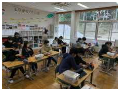
端末でプログラムを作成する6年生