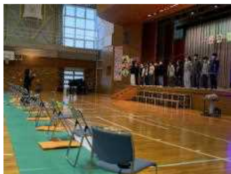
6年生「Tomorrow～みんなへのメッセージ～」