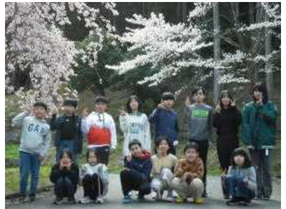
【春：桜の木の下で記念撮影をする6年生】