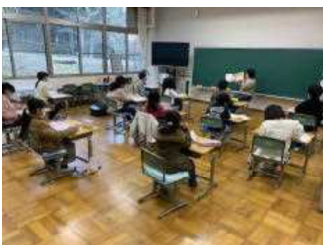
朝の読み聞かせを聞く2年生