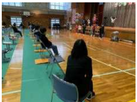
1年生「スマイルをありがとう！」