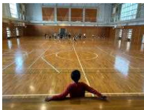
学年PTAで遊びを楽しむ3年生