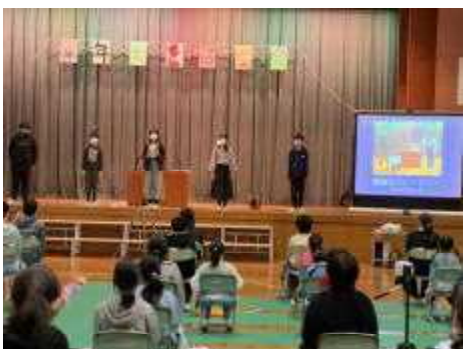
5年生「和知小ウィークリー」