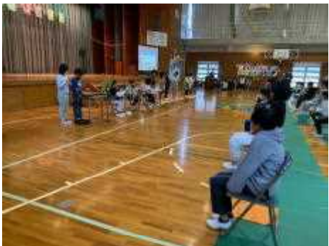
3年生「クイズ 6年生に聞いてみました！」