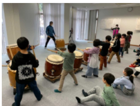
和知太鼓に取り組む1年生

保護者の皆様、うらら会の皆様をはじめ、様々な方々にお世話になりながら3学期の教育活動を進めてまいりました。一部ですが、各学年の学びや活動の様子をご紹介します。