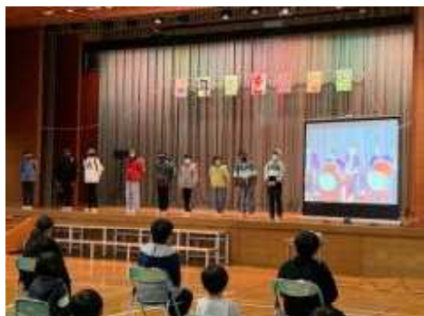
4年生「6年生をおくるもん」

2月24日(金)には、6年生を送る会を開催しました。各学年とも劇や歌・合奏に思いを込めて発表をしました。6年生も自分たちの思い出を劇で発表したり、下級生にメッセージを伝えたりしました。子どもたちの思いが詰まった心あたたまるステキな会となりました。