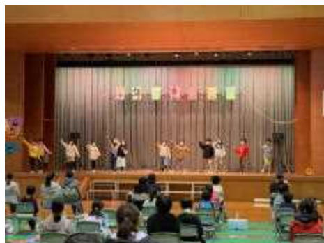
2年生「2年生の気持ちをエールに！ファイトだ6年生」