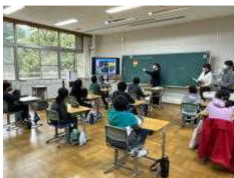
喫煙防止教室を受ける4年生