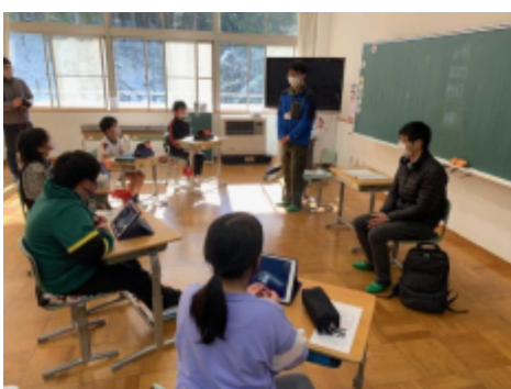
ユキミバナについて話し合う5年生