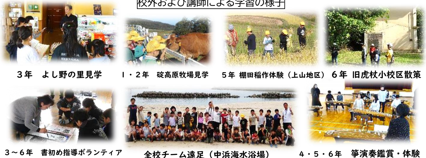
3年 よし野の里見学