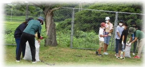
↑ それぞれの役割でお世話になりました。↓

2学期以降も、PTAの皆様と協力し、教育活動の充実を図っていきたく思ひます。ご理解・ご協力の程よろしくお願ひいたします。