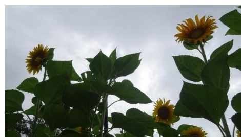
暑さにも負けず大きく育ったヒマワリ。 宇川っ子もこうありたいものです。

さて、2学期といえば期間も一番長く教育活動が最もダイナミックに行われる展開期になります。日々の学習はもちろん、読書感想文の取組、マラソン大会に向けた体力向上の取組、社会見学やチーム遠足、人権の学習など、また一つ上のステージを目指して取組を進めることとなります。そこで大切なことの一つになるのが「目標を高く持つ」ということではないでしょうか。漫然として取組を進め、できた分を評価するのではなく、自分が目指す姿・つきたい力を具体的に設定し、そこに向かって努力を重ねることを大切にしたいと考えています。その上でできたことを自分自身への自信につなげたり、できなかったことは何か、それはなぜだったかを振り返ったりすることが次の取組に生かせることになるのだと思います。ポイントとしては高すぎる目標は掲げないこと。自分の力を分析し出来そうな目標を立てること。この小さなステップを繰り返すことで、己の力を的確に捉え常に次のステージへのレベルアップができるようになります。子どもの内は失敗しても大丈夫。大切なのはそこから次につながる何かを学ぶこと。そうしたことを子ども達へ日々伝えながら様々な実践を進めていきたいと考えています。