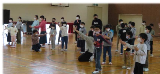
↑全校遊び「もうじゅうがり」