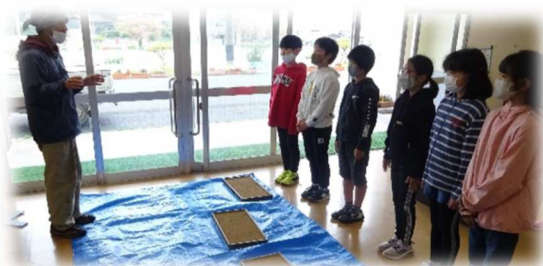
↑地域での米作り体験(種まき)【5年生】