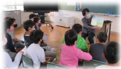
↑読み聞かせボランティア

スタートの1か月となる4月でしたが、さまざまな活動、学習において多くの方との交流がスタートしています。これから1年間、地域をはじめ様々な方の支援のもと、多様な考えに触れ、新しいことに気づいたり、考えを深めたりしていけるよう学習や活動を進めていきます。