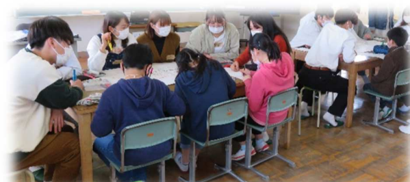
↑大学生との総合的な学習の時間【6年生】