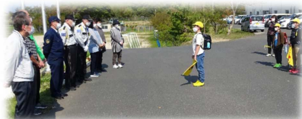
↑安全ボランティア「宇川っ子見守り隊」の方との対面式