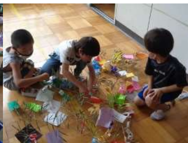
笹飾りを笹に結び付ける2年生

一生懸命に作った「七夕飾り」を笹に飾り付けながら、2年生の子どもたちは、どんな願い事をするのでしょうか？