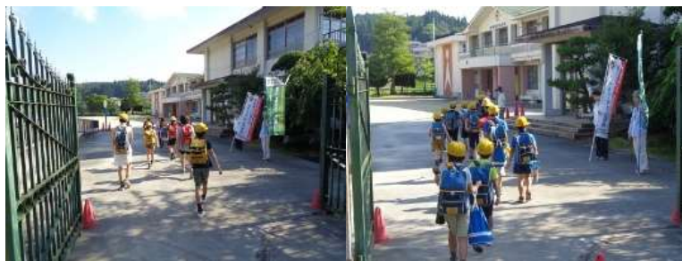
社会教育委員の方とあいさつを交わす