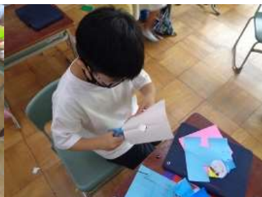
どんな笹飾りを作るのかな？