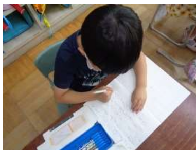
文型に言葉を当てはめて作文する1年生1