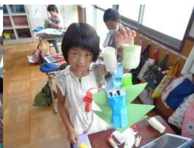
作った笹飾りを見せてくれる2年生2