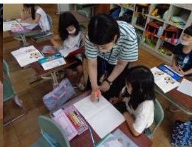
一人一人、書けた作文を見て