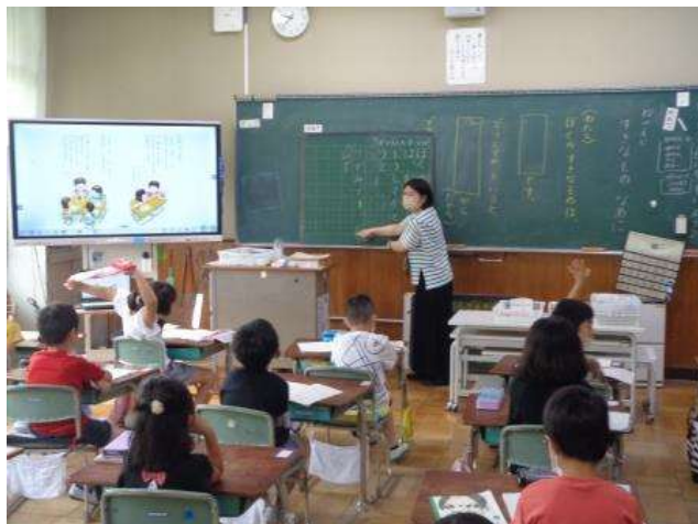
作文する文型を全員で確かめた後

今日、1年1組の教室に行きますと、自分が好きなことと、その理由を紹介する短文作りを行ってました。一人一人、自分の好きなことを「ぼくは（わたしは）～が好きです。」という文型に当てはめて書き、その続きに、その理由を「なぜかというと、～からです。」に当てはめて作文していました。