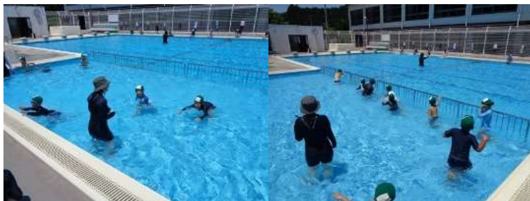
水遊び「水の中を歩く」