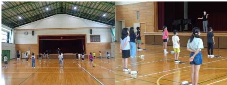
体育館での音楽の授業

今日、体育館（コロナ禍のため感染防止対策として体育館でソーシャル・ディスタンスを確保し学習しています。）に行きますと、6年1組が音楽の学習をしていました。