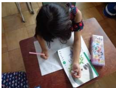
文型に言葉を当てはめて作文する1年生3