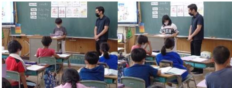
自己紹介をする4年生1

みんなの前に出て、発表することは緊張しますが、どの子も一生懸命に自己紹介をしていました。