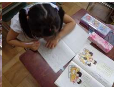
文型に言葉を当てはめて作文する1年生2