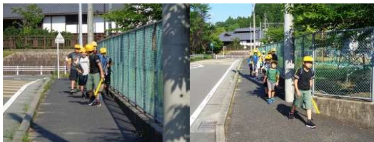
後ろを振り向き列を整える通学班長さん