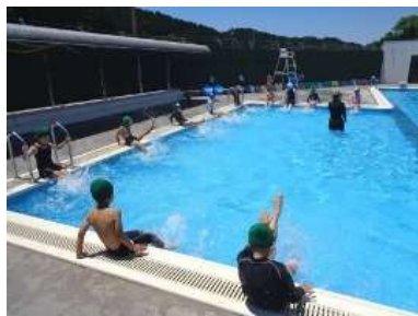
小プールでの水慣れ「バタ足」