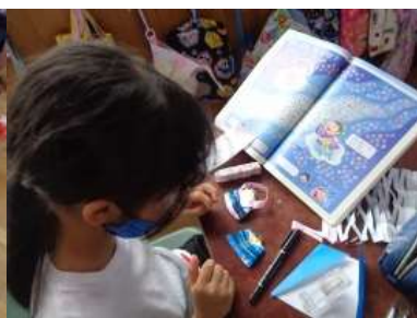
織姫様と彦星様を作る2年生