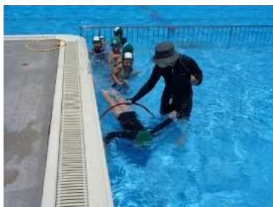
水遊び「水の中での輪くぐり」

3グループのローテーションが上手く回って、前回の「水遊び」の学習よりも「水遊び」の活動が充実しました。