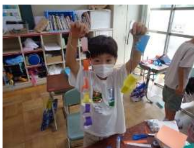
作った笹飾りを見せてくれる2年生1