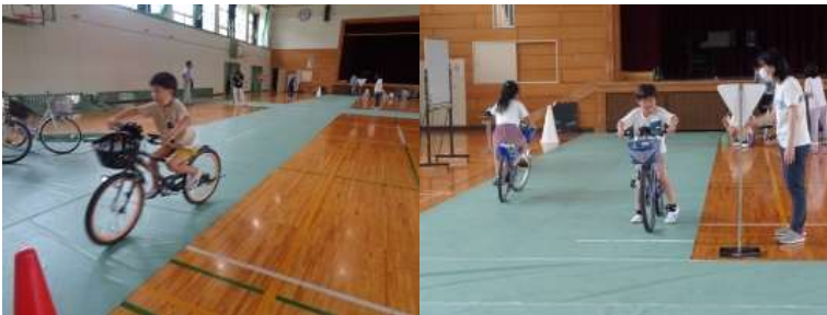
直線コースを上手に走行する様子