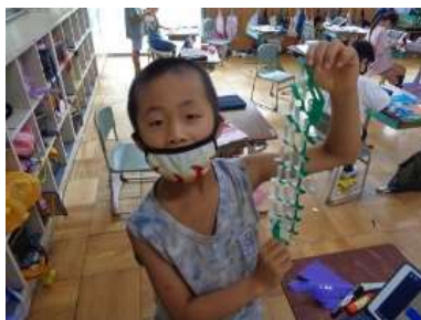
作った笹飾りを見せてくれる2年生3