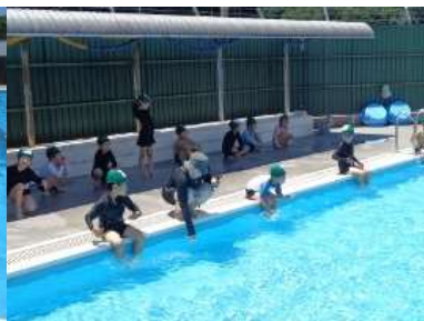
小プールでの水慣れ「お腹にみずかけ」