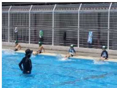
大プールでの水慣れ「バタ足」