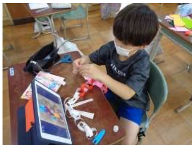
「輪飾り」を作る2年生

今日、2年1組、2組の教室に行きますと、明明後日の七夕の日に向けて「七夕飾り」を作っていました。