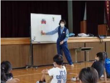
田辺警察交通安全課の署員の方からの 話を聞く子どもたち