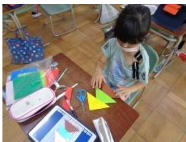
△が3つ、何をイメージしているのかな？