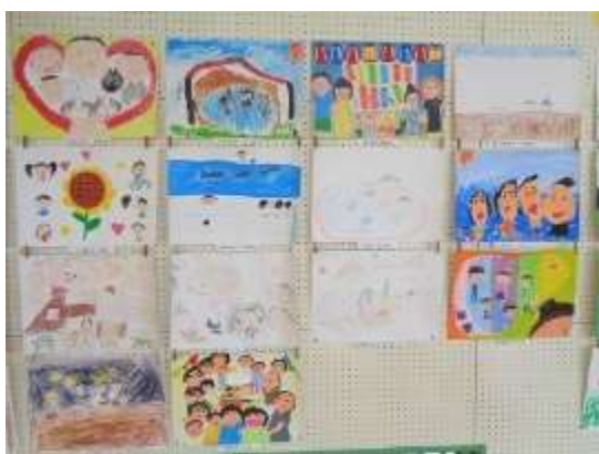
明るい家庭づくり（家族の日）絵画展応募作品等