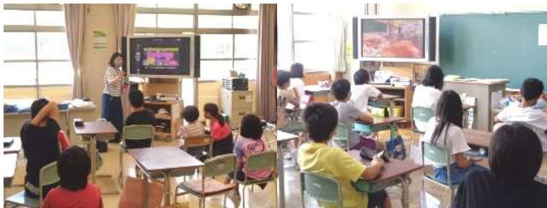
子どもの感染が約4倍になっていることを