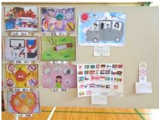
防火ポスター等の平面作品