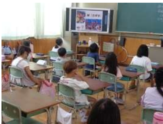
岡本碧優選手とライバル選手の絆

私が子どもたちに伝えた場面は、女子スケートボードパーク決勝の一場面。予選を1位通過した 岡本碧優(おかもと みすぐ)選手が、決勝最後の演技前でメダル獲得が難しくなる中、最後の演技で大技「キックフリップ・インディ」に果敢にチャレンジするも成功せず。涙する岡本選手を、決勝でともに戦っていた海外選手が担ぎ上げ岡本選手を讃えた場面です。