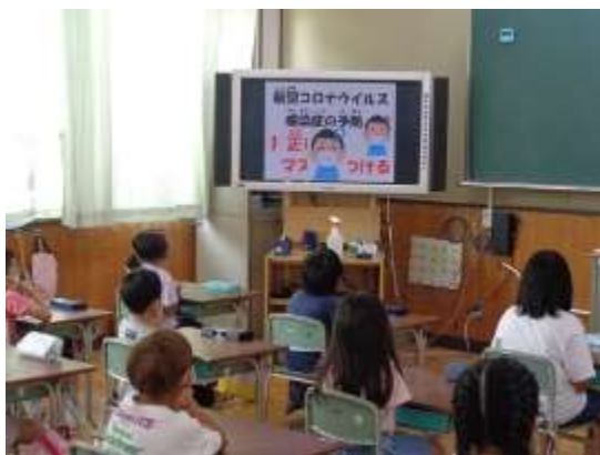
正しいマスクの着用

7月下旬から感染が爆発的に拡大し収まりを見せない中、子どもたちへの感染が当初より約4倍に増えていること。その中で、絶対に守ってほしいこととして、正しくマスクを着用(鼻と・口を覆いマスクと顔の間にできるだけ隙間を作らないこと)することと、正しい手洗い(30秒ほど、手の甲、手のひら、指と指の間、指先、手首等を洗う)を伝えました。