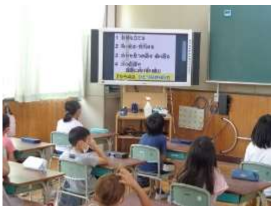
「学びのサイクル」としての4つの力