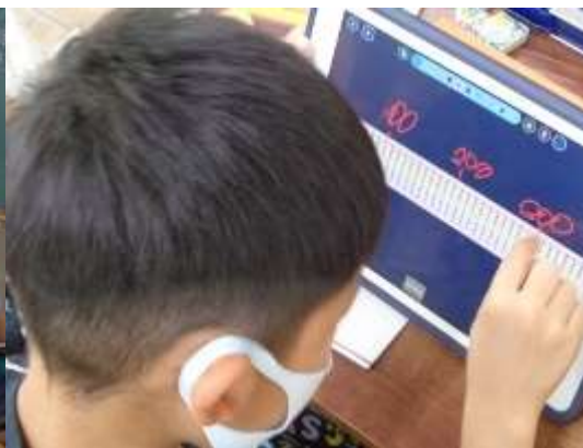
100のかたまりで星の数を数える

次に、三百六十五（個）を数字で表すとどうなるかを考えました。これは、ノートに書くのですが、その説明の時、子どもがタブレットに気をとられないように③「ロック機能」を先生が使いノートに集中できるようにしました。（写真参照）