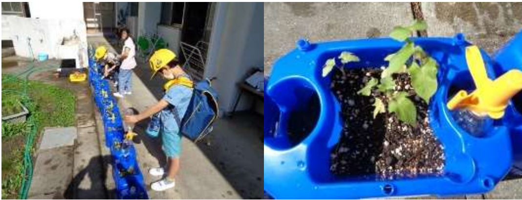
アサガオの水やりをする1年生