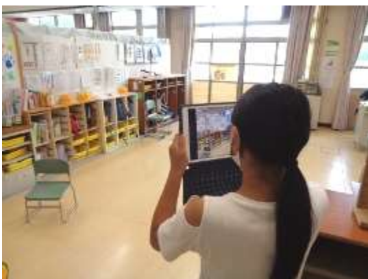
紹介したい箇所の撮影・記録3