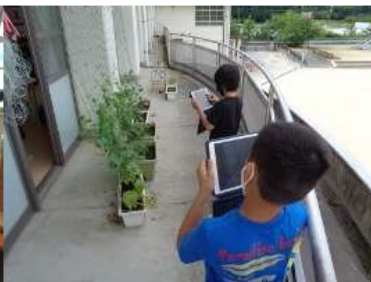
紹介したい箇所の撮影・記録4