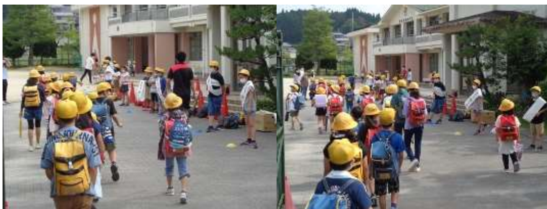
今朝の「あいさつでスマイルプロジェクト」の様子

今日の様子を見ていますと、あいさつリーダーがずらっと並ぶ前を通る子どもたちは、少し気恥ずかしいようでしたが多くの子が挨拶を交わしていました。