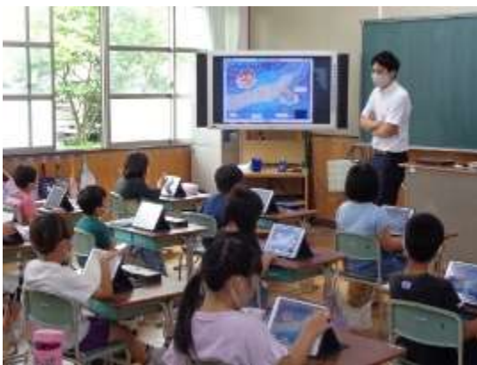
電子黒板に映し出した教科書の挿絵

はじめに、教科書の挿絵「天の川」の星の数を子どもたちに数えさせます。一つずつ数えると大変であることをヒントとして示しながら、自由に数えさせていきますと……。星10個を写真のように囲いながら10を単位とした数の数え方を子どもたちは意識して数え始めました。教科書の挿絵に鉛筆で書き込みをしていくと書き損じたときに消しゴムを使うことになり、しっかり消しきれなくて困ってしまうこともありますが、①タブレット上ですと間違えても「消しゴム機能」を使ってサッと綺麗に消すことができます。