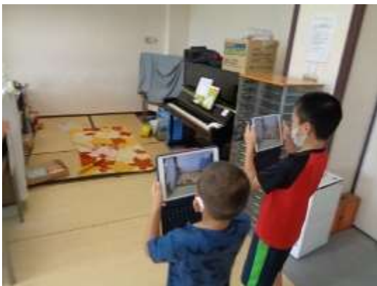
紹介したい箇所の撮影・記録1