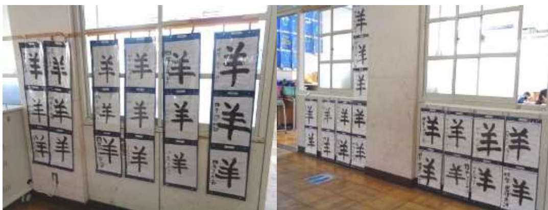
廊下に掲示されている子どもたちの作品

第4学年の教室横の廊下には、子どもたちが書いた作品が掲示してありますので紹介します。現在、掲示されているのは「羊」という文字です。