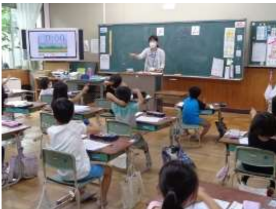
空中で3回「ム」の書き方練習

はじめに、「ム」の書き順を確かめて、カタカナワークシートの大きな「ム」を書き順に従って丁寧になぞっていました。その後は、手を上に上げて空中で書き順に沿って「ム」を3回ゆっくりと書いていました。