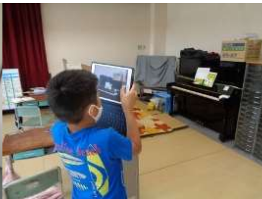
紹介したい箇所の撮影・記録2