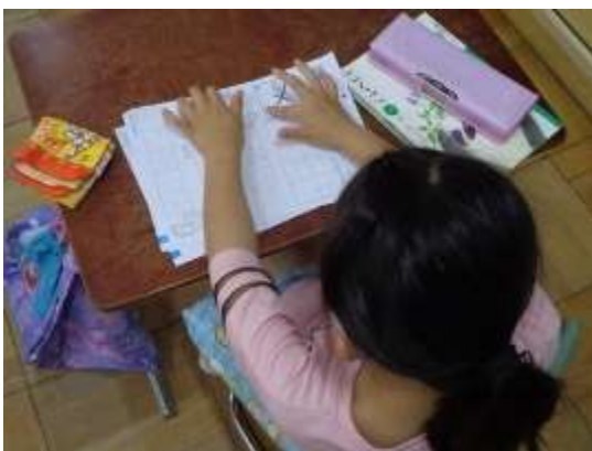
ワークシートの「メ」をなぞって書き方練習

その後、子どもたちはカタカナワークシートに「ム」の字を練習していました。「メ」も同様に学習していましたが、どの子も一生懸命に取り組んでいました。