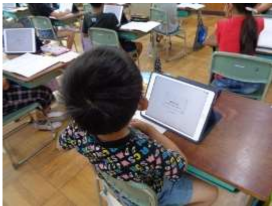
タブレットにロックがかかり先生の説明に集中

すると、中には、「300605」と書く子どもがいました。三百なので300、六十なので60、五は5、よって、「300605」と表記する考えです。「十進位取り記数法」としては間違いですが、子どもなりにしっかり考えた数表記です。