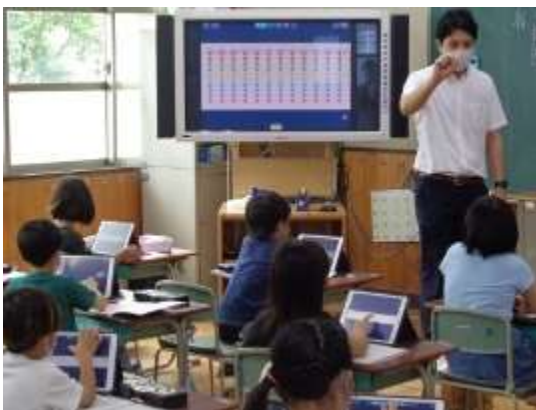
星10個が1列に並んだ図の提示

すると、中には星10個10列分をひとかたまりとして（100を単位として）数える子が出てきました。結果、星の数は100のかたまりが3個と、10のかたまりが6個と残り5個の星があることを確かめ、三百六十五（個）の星があることが分かりました。