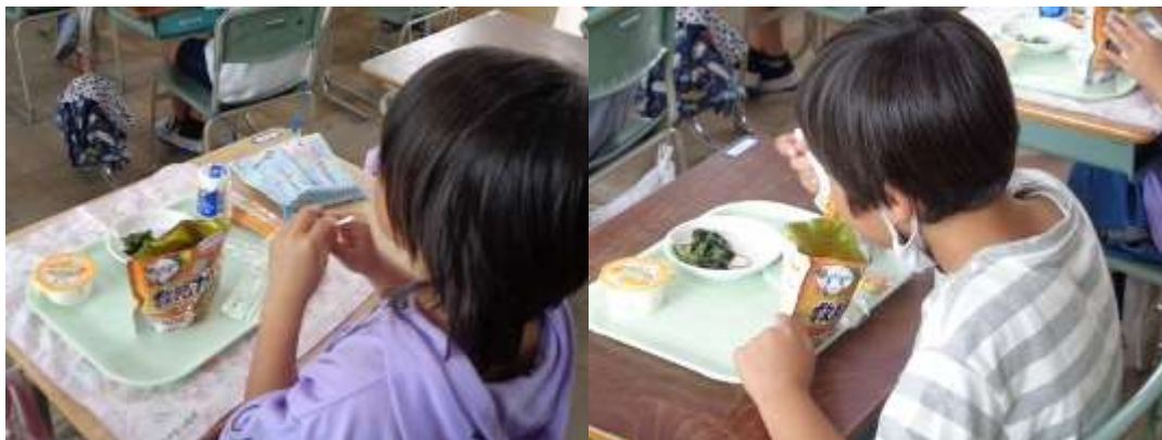
「救給カレー」を食べる様子

子どもたちに「救給カレー」の味について聞いてみましたが、「おいしい」という子が結構多くいました。