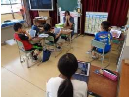
家族に紹介したい箇所の話し合い