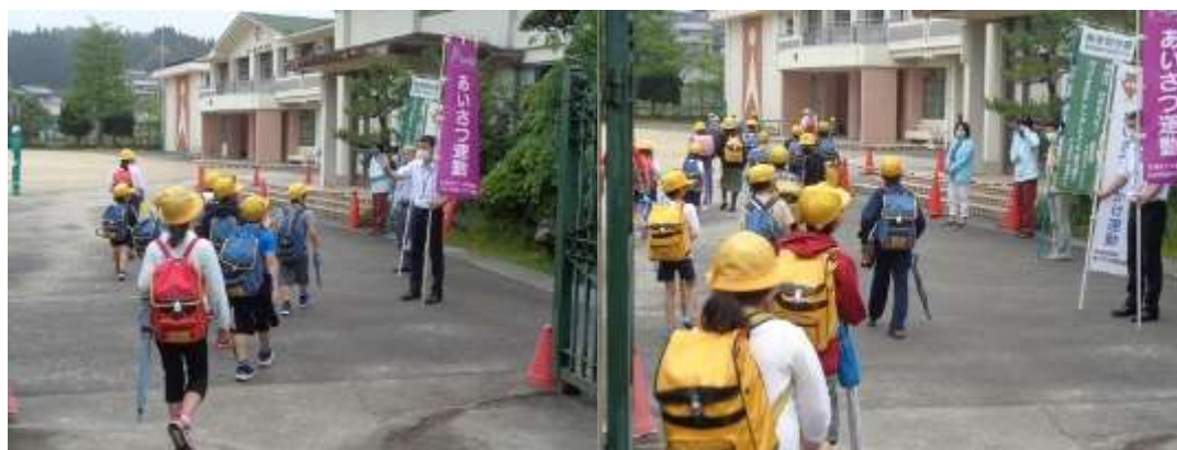
「あいさつ運動」で来てくださったみなさんと挨拶を交わす子どもたち

登校してきた子どもたちも元気な声(マスク着用の上)で挨拶をすることができていました。