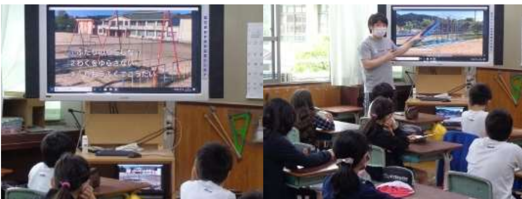
ブランコ遊びの注意点を聞く子どもたち

また、総合遊具については「滑り台を下からのぼらない」「鬼ごっこをしない」など、ブランコについては「二人乗りをしない」「わくをゆすらない」「10往復したら交代する」ということ、鉄棒については、「雨が降った後などは、つゆで鉄棒がぬれていて手が滑りやすくなるのでつかわないようにする」「鉄棒付近でのドッジビーやドッジボール、鬼ごっこなどの禁止」などを確認しました。