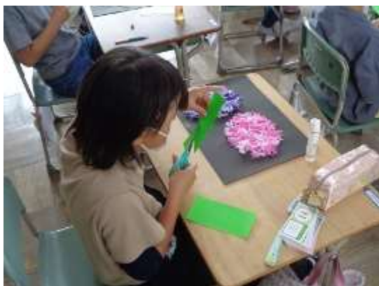
「あじさいの花」のまわりに貼る葉を切り取る様子

まず、お花紙を手でちぎって色画用紙の上のにり付けし、あじさいの花を作っていきます。