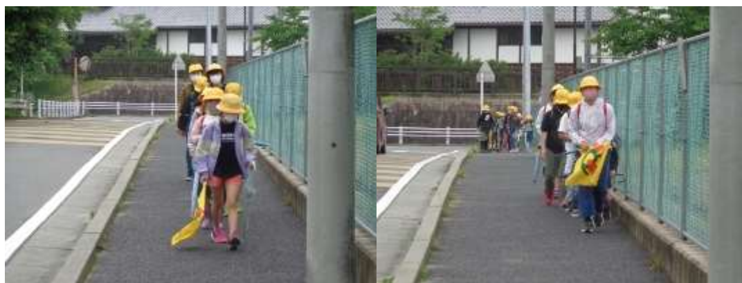
一列になって登校する子どもたち

また、5月12日(水)に本ホームページで紹介しましたが、5月の生活目標は「きちんと並んで登校しよう」となっており、5月6日以降、各班1列になって登校できるように各学級で登校の仕方の振り返りをしていたり、校門で挨拶を交わす際に概ね1列で登校できている班を褒める言葉かけをしたりしてきました。その中で、各班の班長さんが後ろを歩いている子どもたちに声をかけたり、列を意識して歩く子が増えてきたりして、概ね1列になって登校できる班が増えてきました。