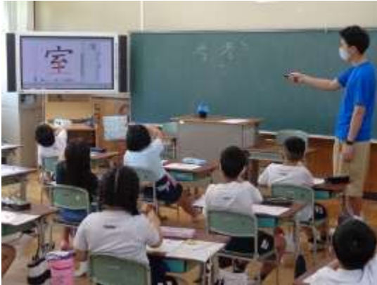
電子黒板に映し出される「書き順」を学習する様子