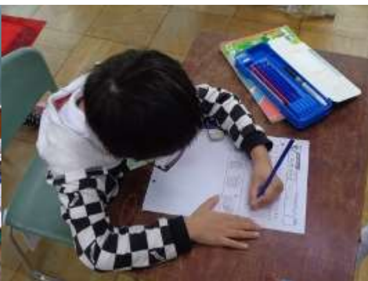
問題び取り組む様子