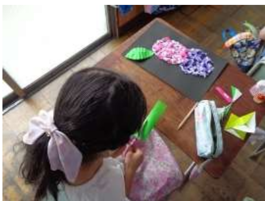
「あじさいの花」を立体的に表現する貼り絵

次に、半分に切った色紙を二つ折りにし、あじさいの葉の輪郭半分を鉛筆で書き、はさみで切って葉っぱを作成。切り取った葉っぱは、折り紙の要領で折って写真のように立体的な葉にしていました。