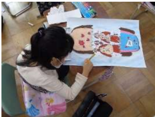
「ふしぎなたまご」の世界を描く子どもたち

制作の様子を見て回りましたが、作品は子どもたち一人一人が想像をふくらませ描き、はさみで切った楽しい「たまご」が画用紙に貼られていました。そして、「たまご」から飛び出すものをクレヨンやパスで描き、絵の具で背景を彩色していました。