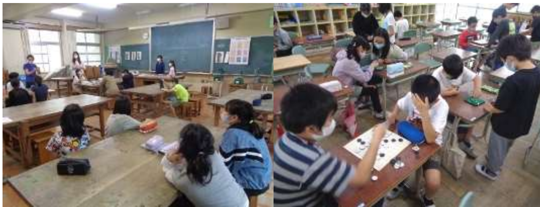
製作したい作品を出し合う美術クラブ

今日のクラブ活動の時間（6時間目）に、各クラブの様子を見て回りました。各クラブともに、クラブ長、副クラブ長を中心に活動の目標や活動計画を立てました。