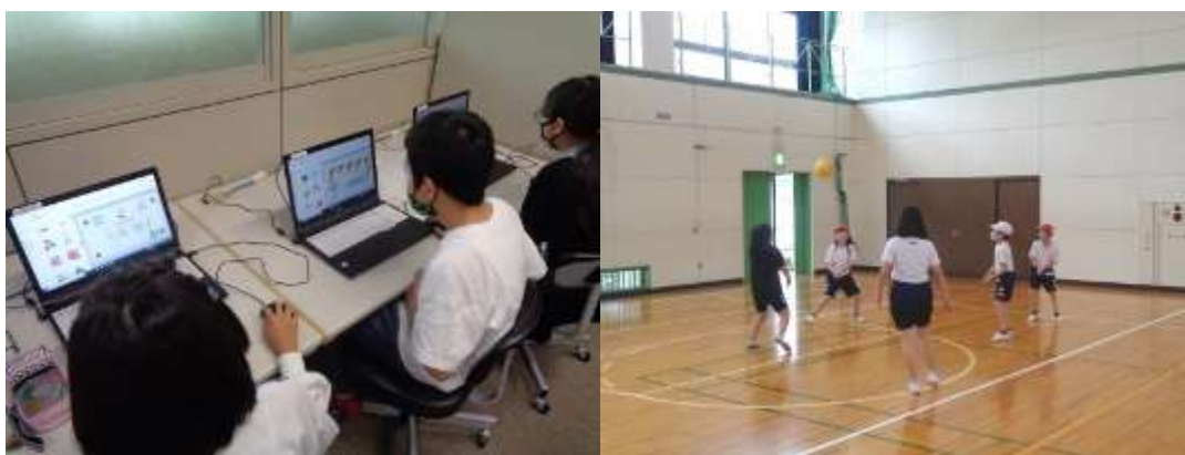
名刺を製作するパソコンクラブの子どもたち

その後、運動場が活動場所の2つのクラブは、時間をかけて活動計画を立てたり、ルールや運動の要領などについて担当の先生が話されました。屋内でできるクラブは、さっそくそれぞれの活動に入っていました。