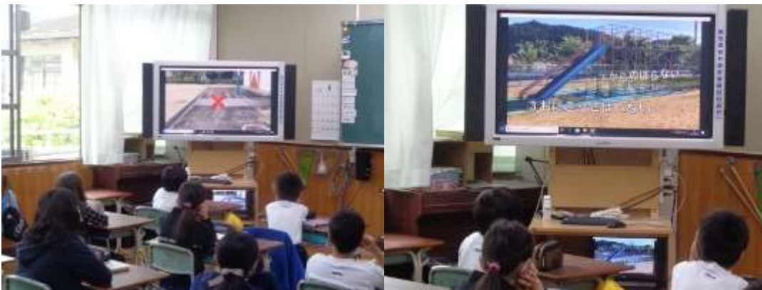
ビデオ視聴しながら保健委員の説明に聞き入る子どもたち

遊んではいけない場所【希望棟前から未来棟前や希望棟と未来棟の間、和み棟南側のアスファルトの部分など】については、年度初めに各学級で学習していますが、今日、改めて全校で確認しました。