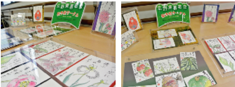
「広野東喜老会・絵手紙サークル」のみなさまの展示