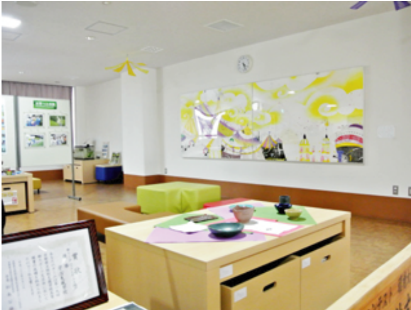
本校エントランスホール 展示コーナー