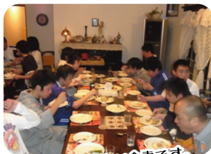
みんなとおいしい食事です。