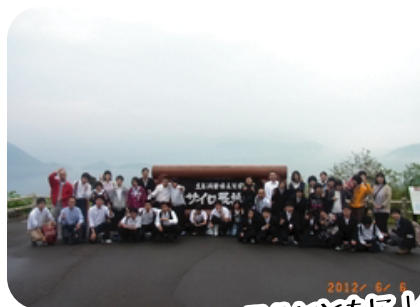
洞爺湖の幻想的な景色とともに！