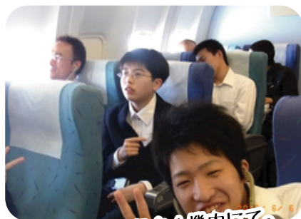
楽しい！ドキドキ！機内にて。

3日間を通して、ホテルの滞在時等、生徒たち同士が協力し合う場面が多く見られ、助け合うことなど、団体生活としての学習をたくさん積んでいる姿が光っていた3日間となりました。また若干、行程の予定時間より遅れることもありましたが、生徒たち全員が無事に行程を終え、多くの見聞、体験を通して、今後の学習の基盤を広げることができる3日間となりました。