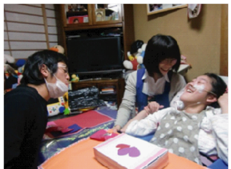
訪問生も 自宅で 実習内容に 取り組み ました。