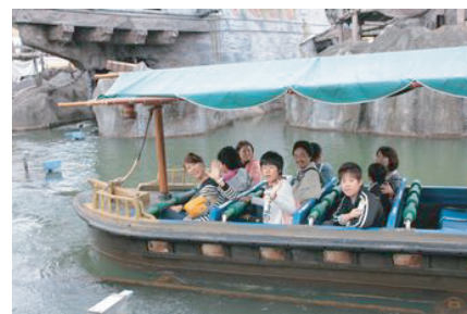
志摩スペイン村にて