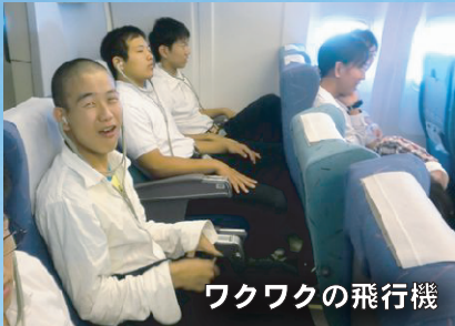
ワクワクの飛行機

3日間、天候にも恵まれ、みんな無事に楽しく3日間の日程を終えることができ、関係者の皆さまにも感謝しております。旅を通して、生徒たちが新しい出会いや体験、様々な経験を積み、また一步自信をつけることができた旅になったのではと思っています。ありがとうございました。