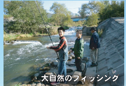
大自然のフィッシング