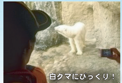
白クマにびっくり！