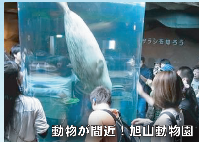
動物が間近！旭山動物園