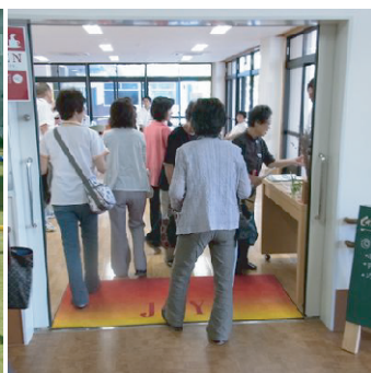
カフェ・JOY（開店後）の様子