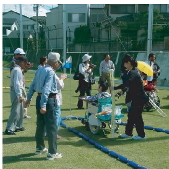
スポーツフェスタ（グラウンドゴルフ）の様子