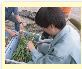
希望サービスでの作業