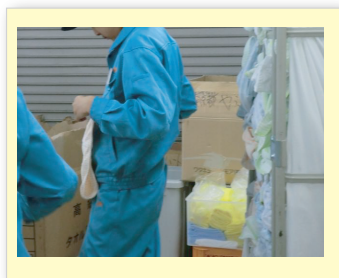
希望職種「リネン業務」の実習